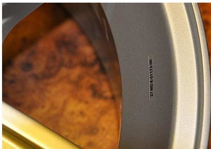
Umiestnenie schvaľovacej značky vydanej MDVRR SR na diskovom kolese