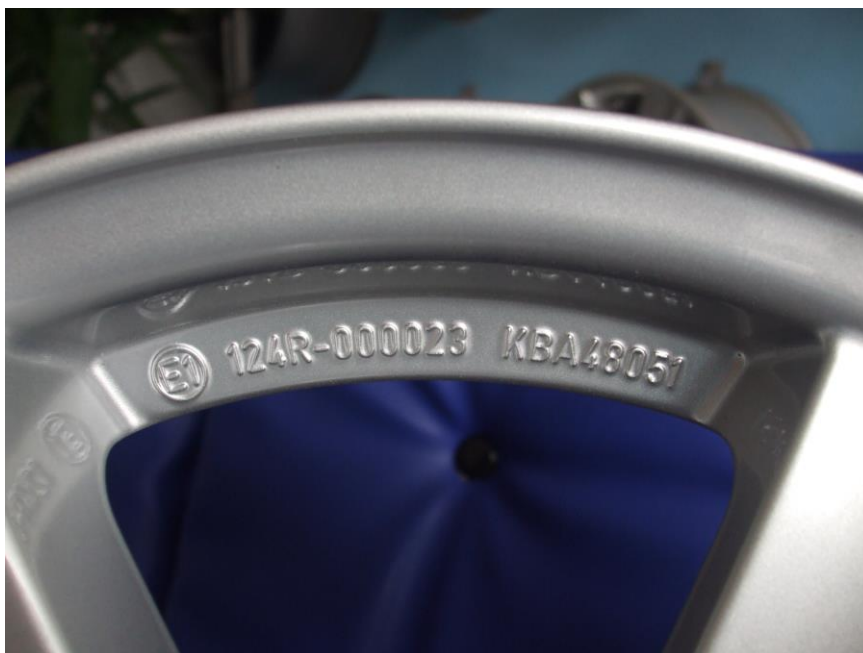
Príklad umiestnenia homologizačnej značky na diskovom kolese.

Umiestnenie homologizačnej značky na kolese môže byť rôzne, pričom štandardne sa značka umiestňuje na viditeľnú plochu diskového kolesa.